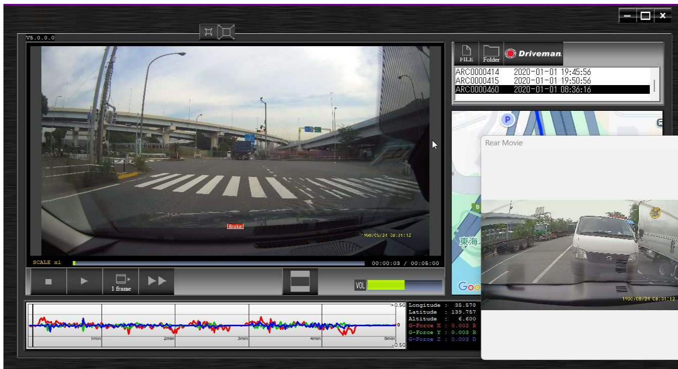
■上図はポップアップ時の画面例